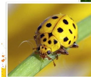
Красная и жёлтая божьи коровки